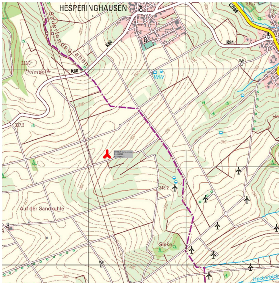
Abb.1: Auszug Übersichtskarte mit Standort M-WEA 5 (Koordinaten: R:32U493188 H:5.701.127)

Die konkrete Lage und vorgesehene Anordnung der Anlagen mit ihren Zuwegungen sind dem Kapitel 3 zu entnehmen.